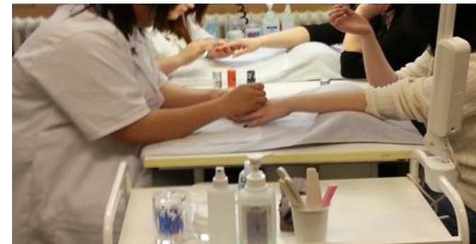
Ziele / Möglichkeiten