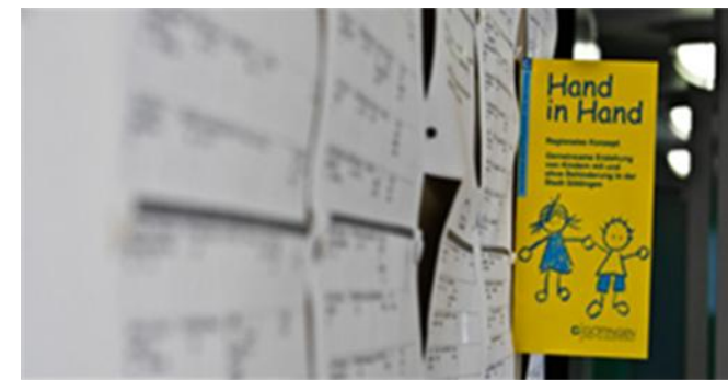
Ziele / Möglichkeiten

Neben dem fachpraktischen Unterricht in der Schule absolvieren Sie als weiteren Qualifizierungsbaustein zwei jeweils zweiwöchige Praktika in geeigneten Betrieben.