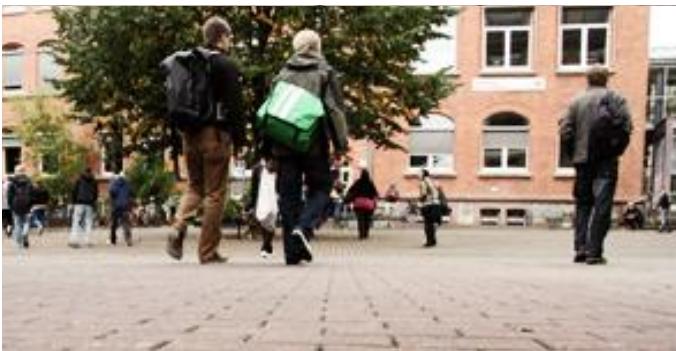
Was erwartet mich?