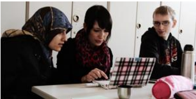
Welchen Unterricht habe ich?