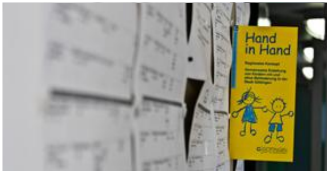
Welche Ziele hat die Sprachförderklasse?

Neben dem fachpraktischen Unterricht in der Schule absolvieren Sie ein Praktikum in geeigneten Betrieben.