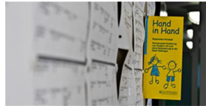
Ziele / Möglichkeiten