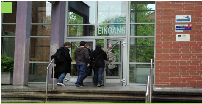
Drei Schwerpunkte Ihre Voraussetzungen