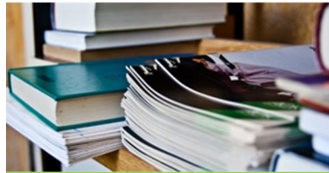
Prüfungsfächer Ihre Perspektiven

In der Qualifikationsphase (Q1 und Q2) wird der Unterricht im ersten Profilfach und zwei weiteren allgemeinbildenden Fächern auf erhöhtem Niveau unterrichtet. Der Unterricht in den weiteren Fächern erfolgt auf grundlegendem Niveau. In allen Fächern wird das Zentralabitur durchgeführt - mit Ausnahme des Faches Berufliche Informatik.